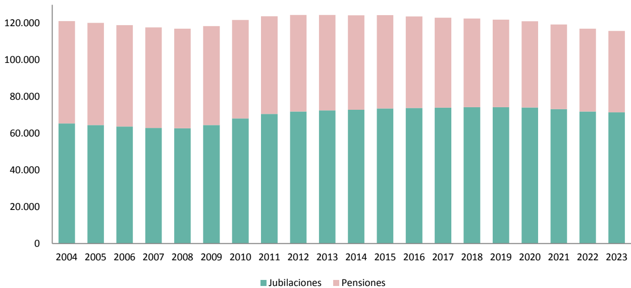
GRÁFICO 2. EVOLUCIÓN PASIVIDADES RURALES IVS