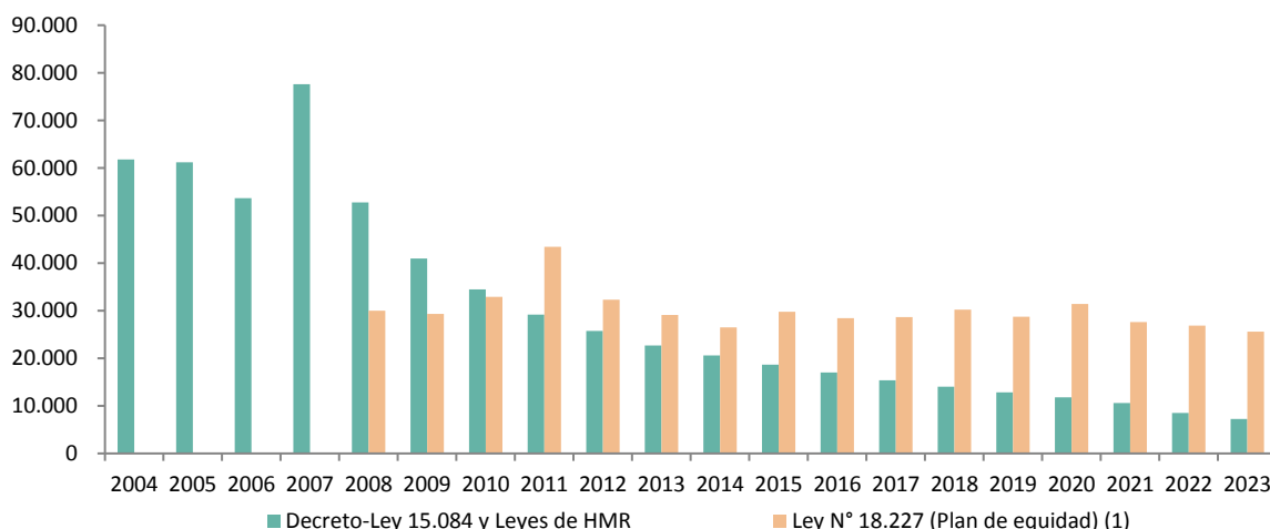
GRÁFICO 3. EVOLUCIÓN DE LOS BENEFICIARIOS POR ASIGNACIONES FAMILIARES DEL SECTOR RURAL EN URUGUAY DURANTE EL PERÍODO 2004-2023.

(1) Valores estimados y ajustados en base a Microdatos ECH (2022)