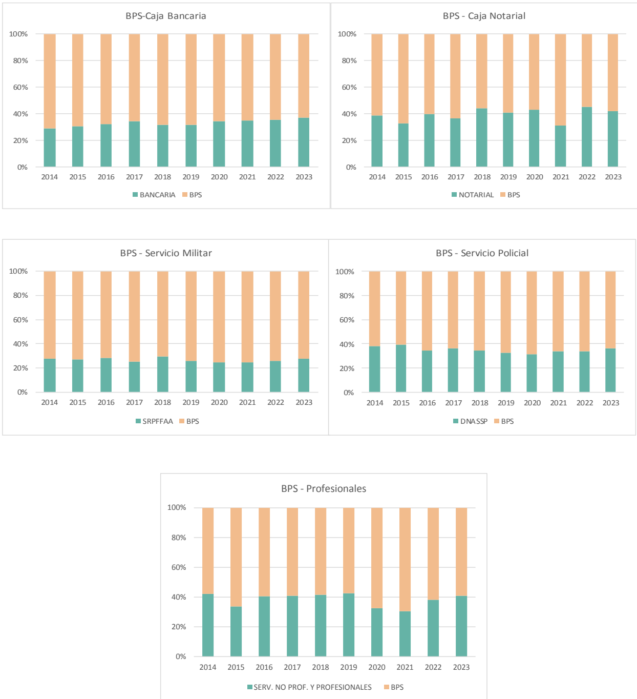
Gráfico 3. Porcentaje de años reconocidos por BPS y por los otros organismos

Lo primero que se visualiza es que en todos los casos BPS siempre tiene la mayoría en la acumulación. En términos generales podemos afirmar que la Caja Profesional y Notarial son aquellas con la cual se generan mayor cantidad de años reconocidos por acumulación, y la de menor incidencia es el Servicio de Retiros y Pensiones Militar.