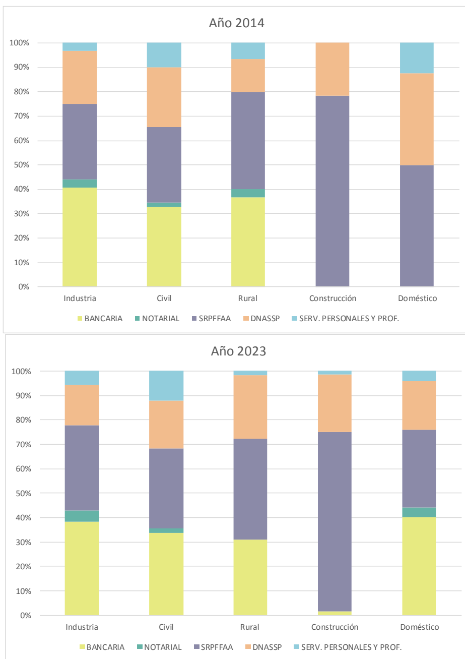
Gráfico 4. Estructura de acumulación con otros organismos de servicios según tipo de aportación, para años seleccionados

En cuanto a la aportación Industria y Comercio, se observa que no ha sufrido grandes variaciones al comparar el primer y último año objeto de estudio.