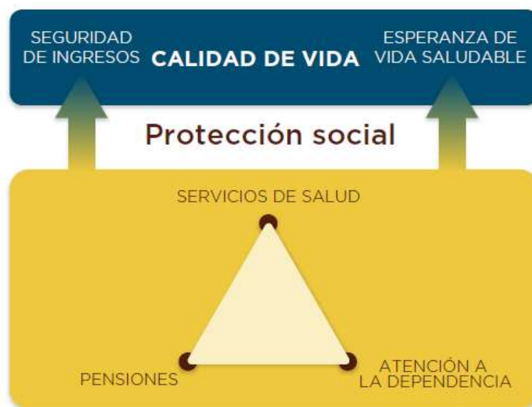
GRÁFICO 3.1 ELEMENTOS CLAVE DE LA CALIDAD DE VIDA Y LA PROTECCIÓN SOCIAL DE LAS PERSONAS MAYORES