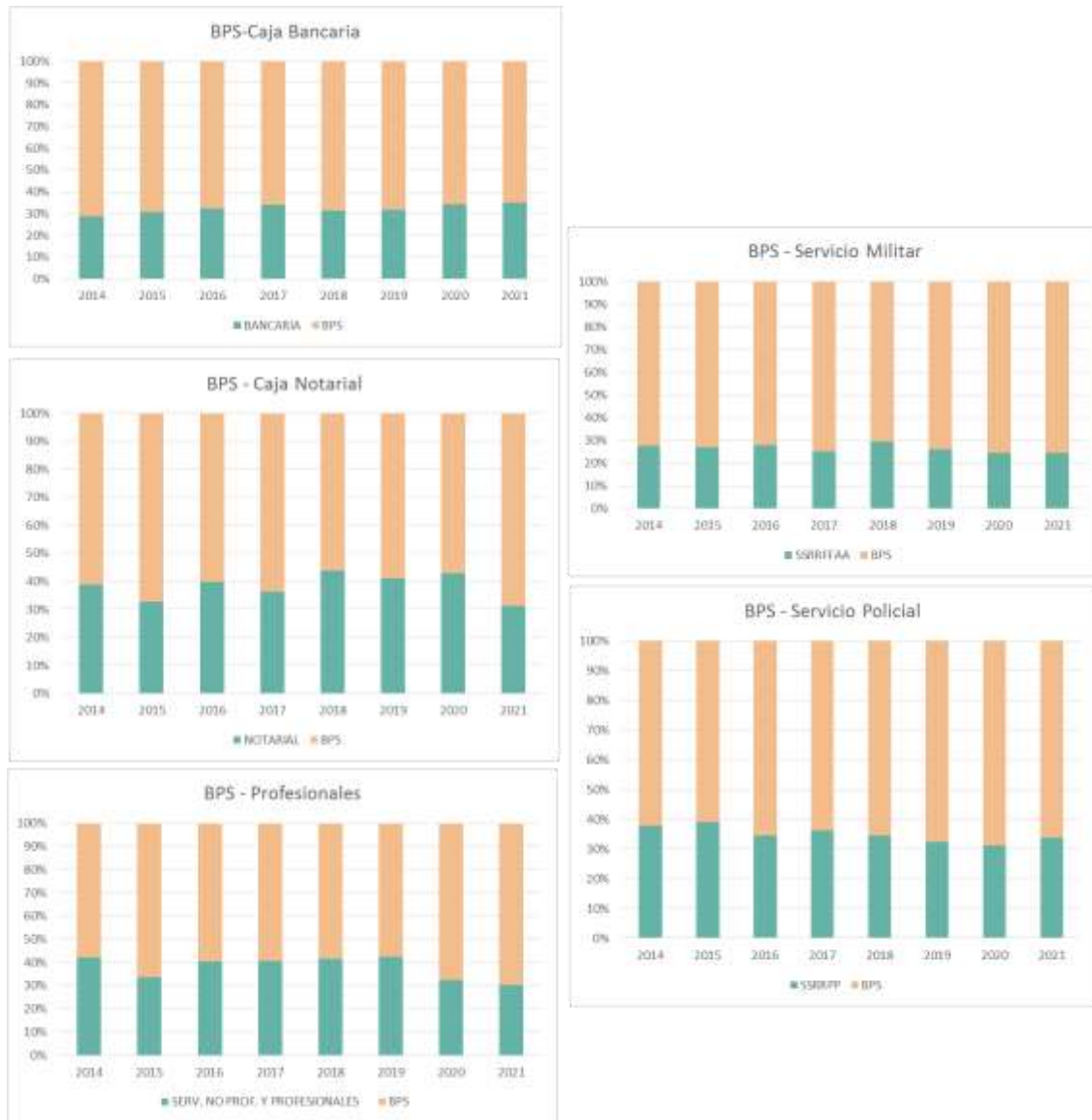
Gráfico 3. % de años reconocidos por BPS y por los otros organismos

Lo primero que se visualiza es que en todos los casos BPS siempre tiene la mayoría en la acumulación. En términos generales podemos afirmar que la Caja Profesional y Notarial son aquellas con la cual se generan mayor cantidad de años reconocidos por acumulación, y la de menor incidencia es el Servicio de retiros Militares.