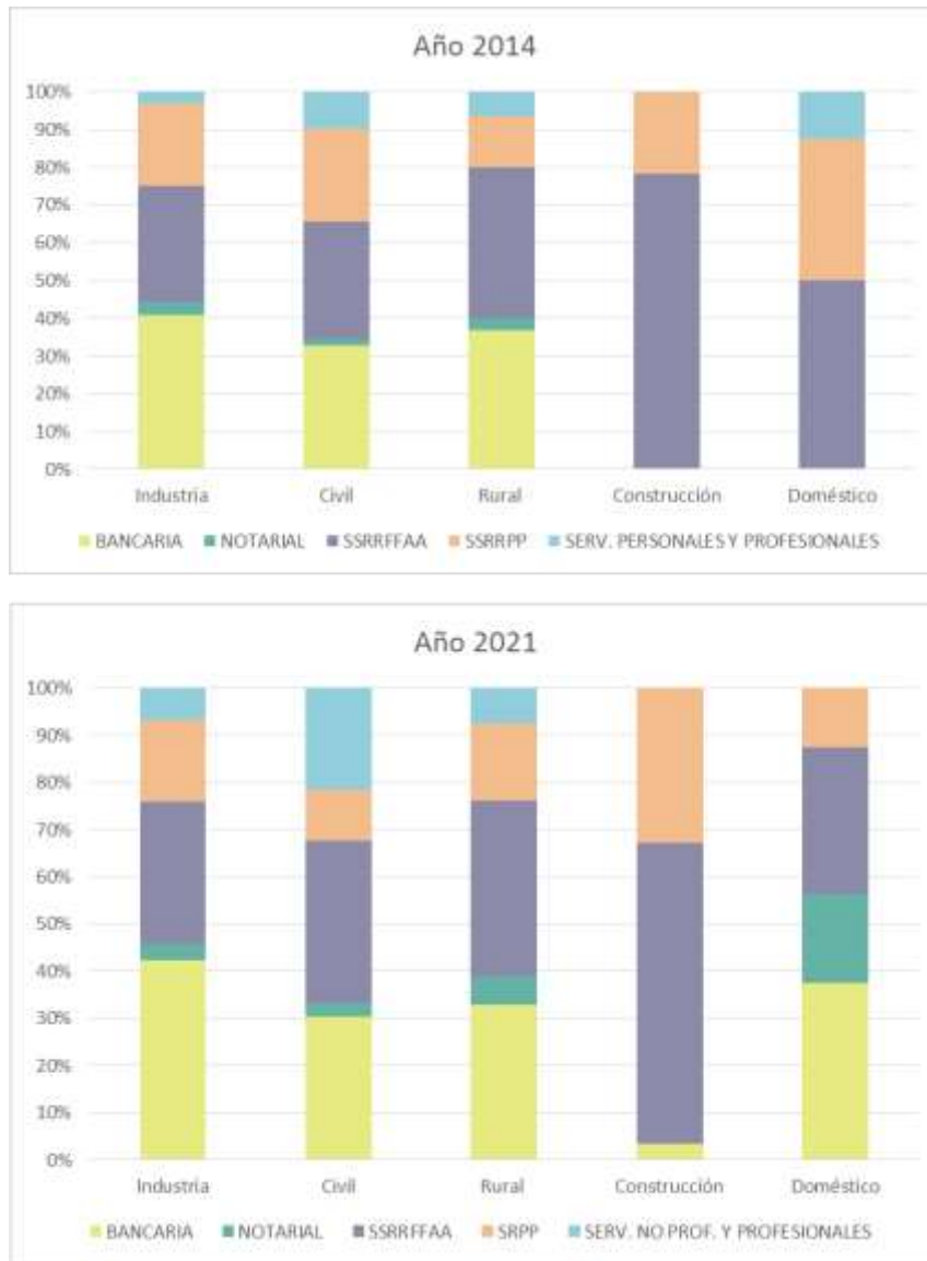
Gráfico 4. Estructura de acumulación con otros organismos de Seguridad Social según tipo de aportación, para años seleccionados

En ambos años seleccionados se visualiza claramente la acumulación con años amparados por Caja Bancaria (color amarillo) se verifica mayormente en las aportaciones de Rural e Industria y Comercio, mientras que la acumulación de años servidos en las Fuerzas Armadas, en su mayoría corresponden a la aportación de construcción, aun cuando tiene presencia en todas las otras aportaciones.