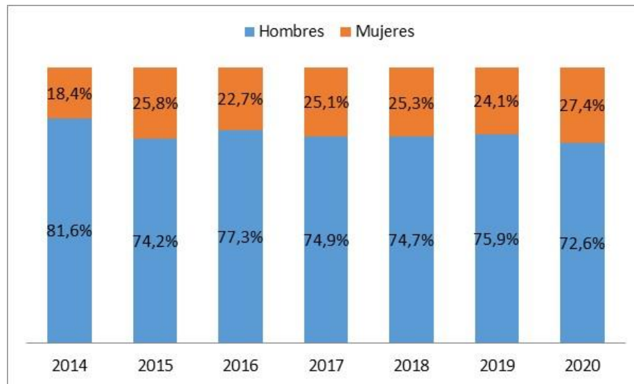
Gráfico 1. Altas por acumulación según sexo y año

El año 2020 muestra la mayor participación de mujeres con acumulación de servicios, llegando al 27.4% del total.