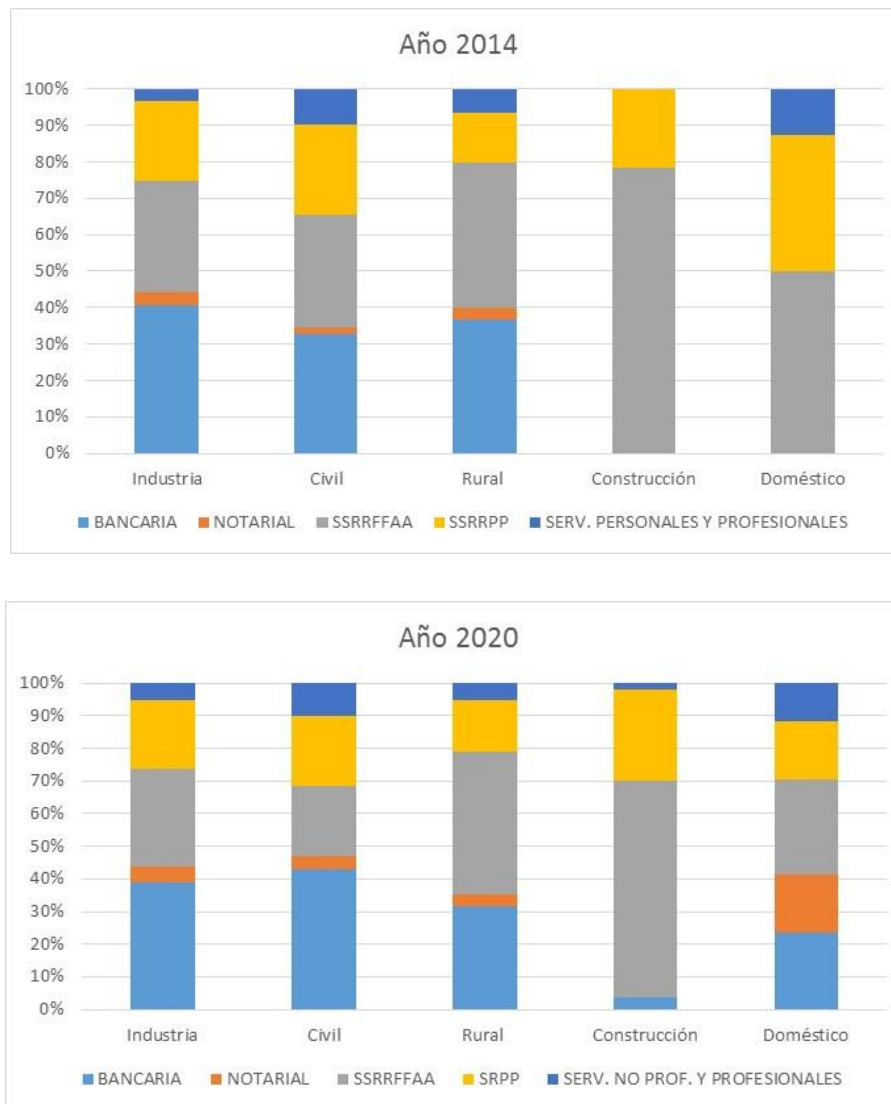
Gráfico 4. Estructura de acumulación con otros organismos de SS según tipo de aportación, para años seleccionados

En ambos años seleccionados se visualiza claramente la acumulación con años amparados por Caja Bancaria (color azul claro) se verifica mayormente en las aportaciones de Civil e Industria y Comercio, mientras que la acumulación de años servidos en las Fuerzas Armadas, en su mayoría corresponden a la aportación de construcción, aún cuando tiene presencia en todas las otras aportaciones.